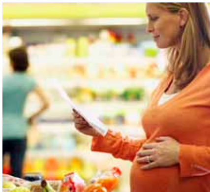
Door zorgvuldig te letten op wat u eet, beschermt u uw kind

Een infectieziekte wordt veroorzaakt door een bacterie, virus, parasiet of schimmel. Onder deze ziekteverwekkers zijn er een paar die vooral tijdens de zwangerschap problemen kunnen veroorzaken. De belangrijkste zijn: