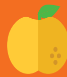
abrikoos 1 week