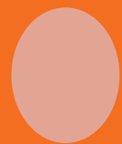
ei 1 maand